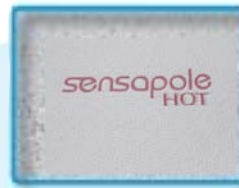
sensapole hot - wärmende Wirkung

Eine spezielle Mischung aus Pflanzen- und Blumenextrakten (u.a. rote Paprika) fördert die Blutzirkulation in der Haut und verschafft eine sanfte, wärmende Wirkung.