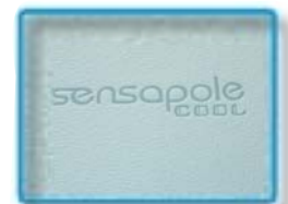
sensapole cool - kühlende Wirkung

Eine spezielle Mischung aus Pflanzen- und Blumenextrakten (u.a. rote Paprika) fördert die Blutzirkulation in der Haut und verschafft eine sanfte, wärmende Wirkung.