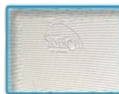
silver protect - antiallergische Wirkung

Eine spezielle Mischung aus Pflanzenextrakten (u.a. Birke) absorbiert Wärme. Die Funktion wird durch die natürliche Körperfeuchtigkeit ausgelöst und kühlt den Stoff ab, solange die Feuchtigkeit erhalten bleibt.