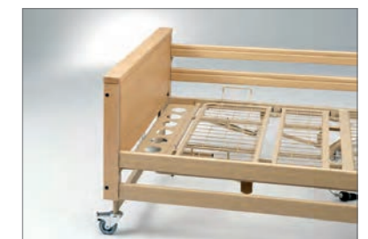
Integrierte Bettverlängerung inkl. Seitengitterholme und Einsatz