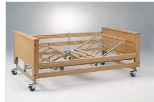
Unterschenkellehne manuell einstellbar